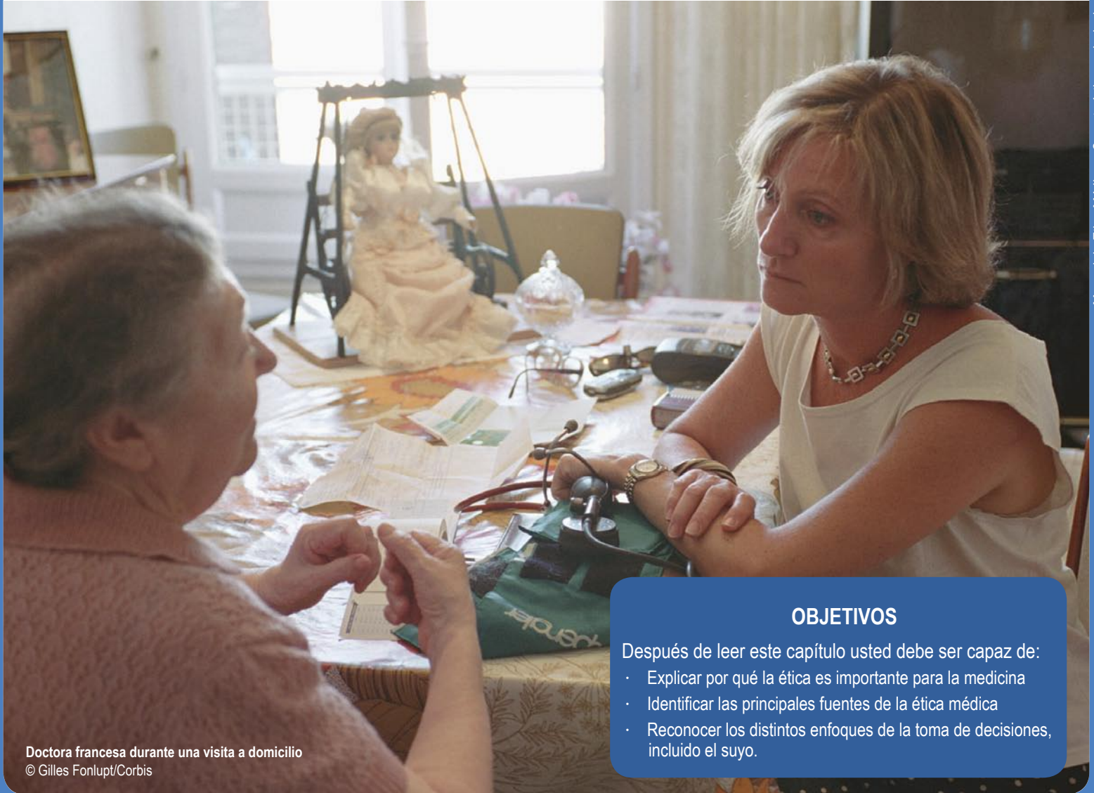
Doctora francesa durante una visita a domicilio