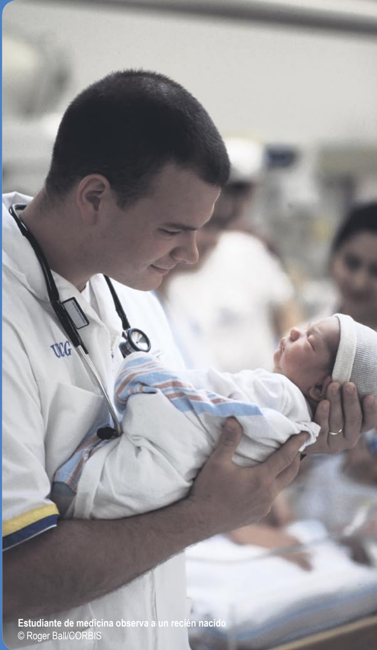
Estudiante de medicina observa a un recién nacido