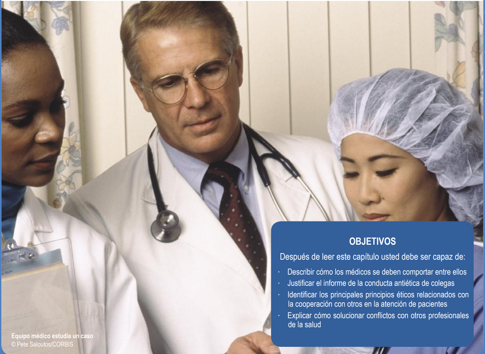
Equipo médico estudia un caso